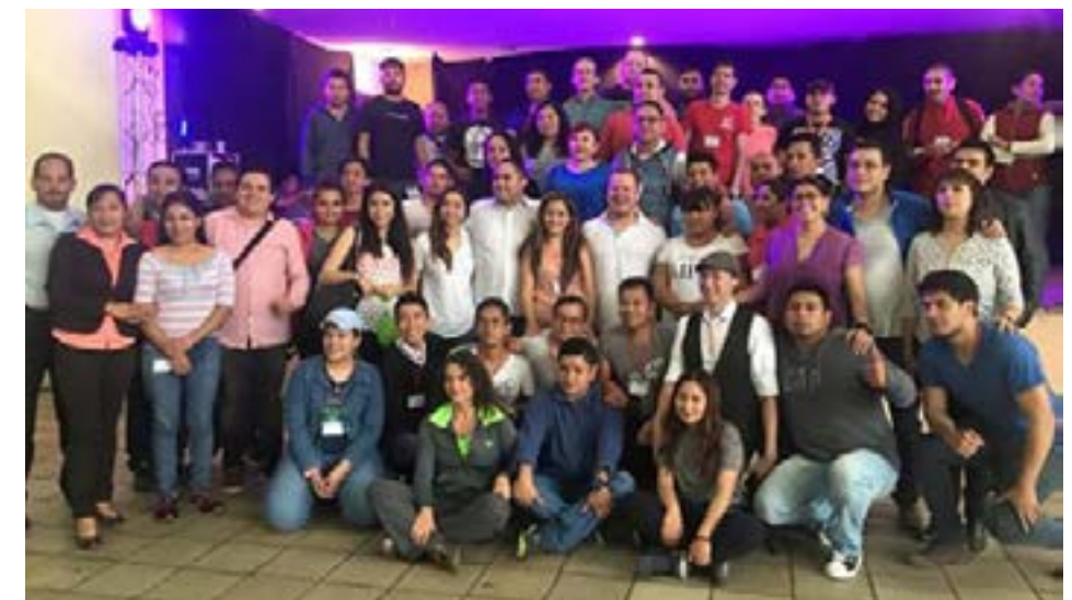
Conformación de la Red México.