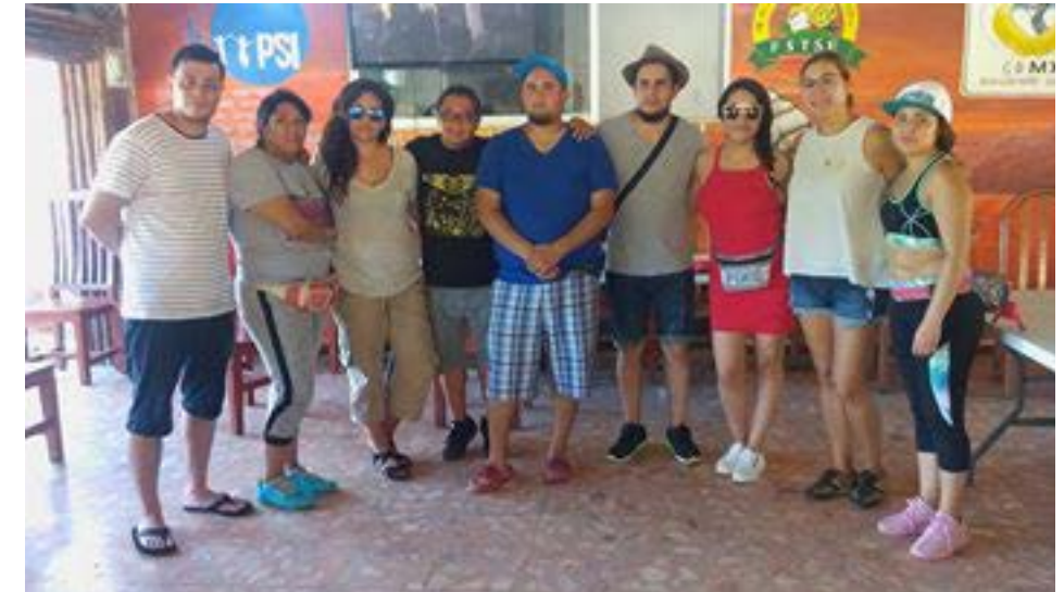
Comité de Juventudes de la RED-México