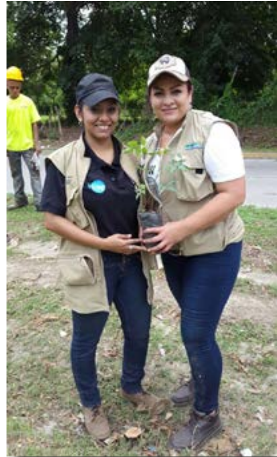
Comite de jóvenes SIDEYTMS, Honduras.

Campaña de arborización por parte de personas jóvenes de Honduras.