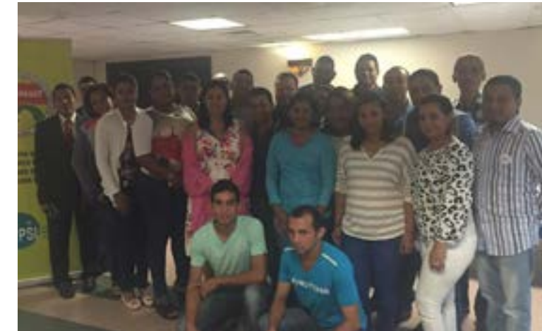
Encuentro de las Juventudes Panamá