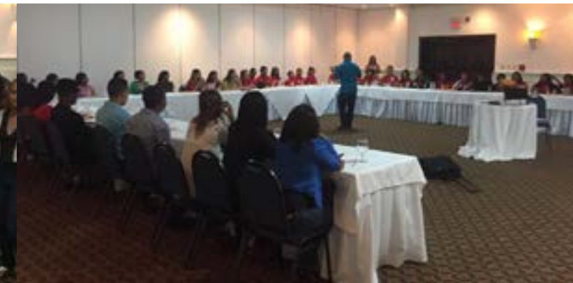
Seminario Juventudes sector salud