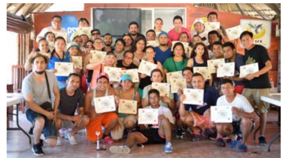
Primer Encuentro de Juventudes Red Local de Juventud México.