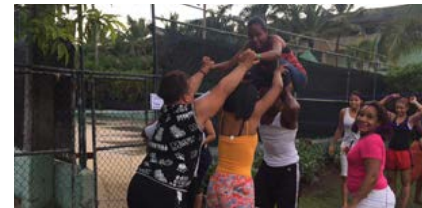
Taller de liderazgo y trabajo en equipo República Dominicana