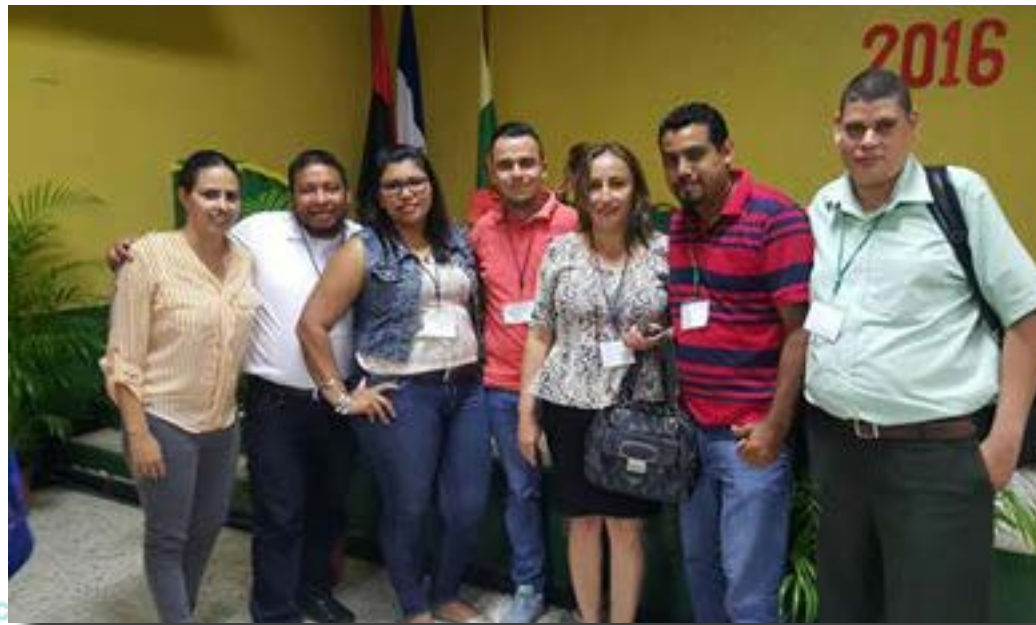
Comisiones de la juventud de SITRAMEDHYS en San Pedro Sula

Participación en el II Encuentro de las Juventudes ANEPISTAS-COSTA RICA.