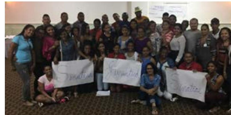
Encuentro de las Juventudes de la República Dominicana.