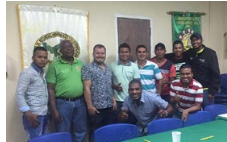
Conformación del Comité de Juventudes de SITIESPA-Panamá

Reunión y conformación del Comité de Juventudes de la organización sindical SITIESPA -PANAMA.