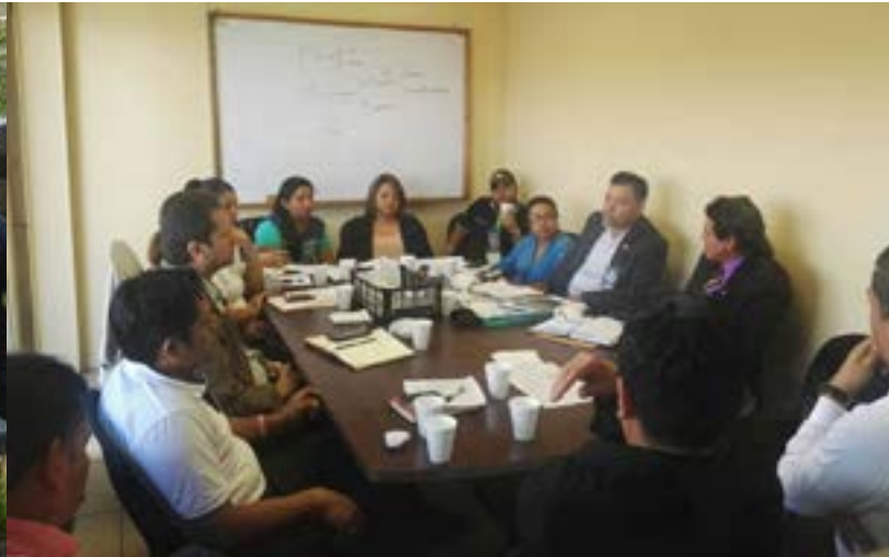
Reunión de trabajo en la cede del STOL