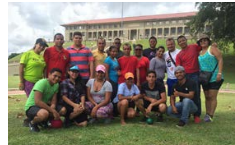
Taller liderazgo, comunicación y trabajo en equipo Panamá