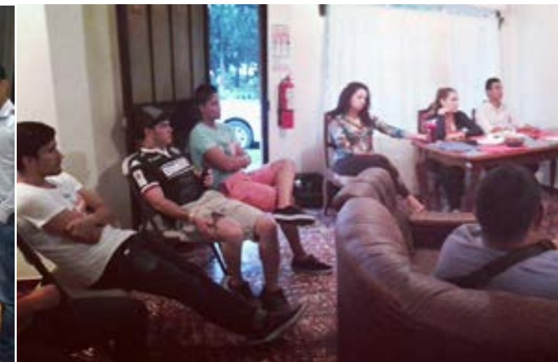
Reunión Comité de Juventudes ISP-Costa Rica.