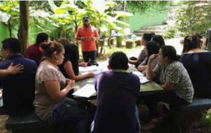
El Comité Nacional de la Juventud de Guatemala llevo a cabo, con el apoyo de la ISP, el taller de reforzamiento del ABC sindical.