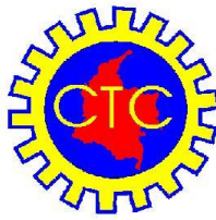
Confederación de Trabajadores de Colombia